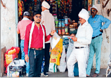
फैलती है। जिसे ध्यान में रखते हुये नगर निगम का अतिक्रमण दस्ता प्रतिदिन निरीक्षण कर कार्रवाई कर रही है, कार्रवाई के तहत आज जूनीहट्टी में मकान बनाने रोड उपर रेत मटेरियल को हटाने संबंधित को निर्देशित कर 1 हजार 5 सौ रूपये अर्थदण्ड, इसी प्रकार लोहारा पारा में रोड में मटेरियल रखने पर संबंधित से 3 हजार रूपये अर्थदण्ड अधिरोपित किया गया। इसी प्रकार प्लास्टिक प्रतिबंधित करने शासन निर्देश के अनुक्रम में नगर निगम द्वारा प्रतिदिन व्यवसायिक प्रतिष्ठानों की जांच कर साफ सफाई रखने, प्लास्टिक के उपयोग व विक्रय पर प्रतिबंध